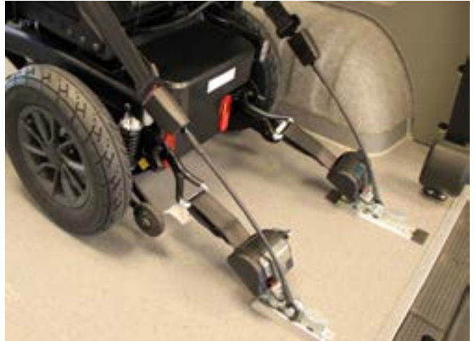
Figure 3 : arrimage par sangles (vue arrière)