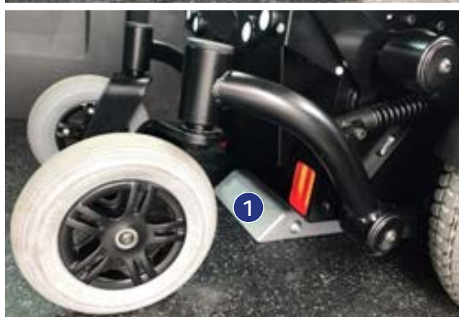
Figure 7 : ancrage automatique