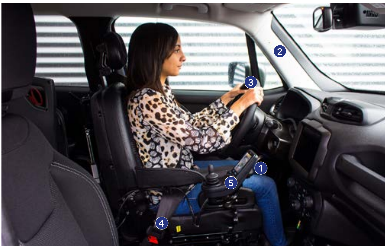
Figure 6 : installation poste de conduite (rang 1)

Selon l'arrêté du 21/12/2005, « tout conducteur à la responsabilité de s'assurer de son aptitude à conduire ».