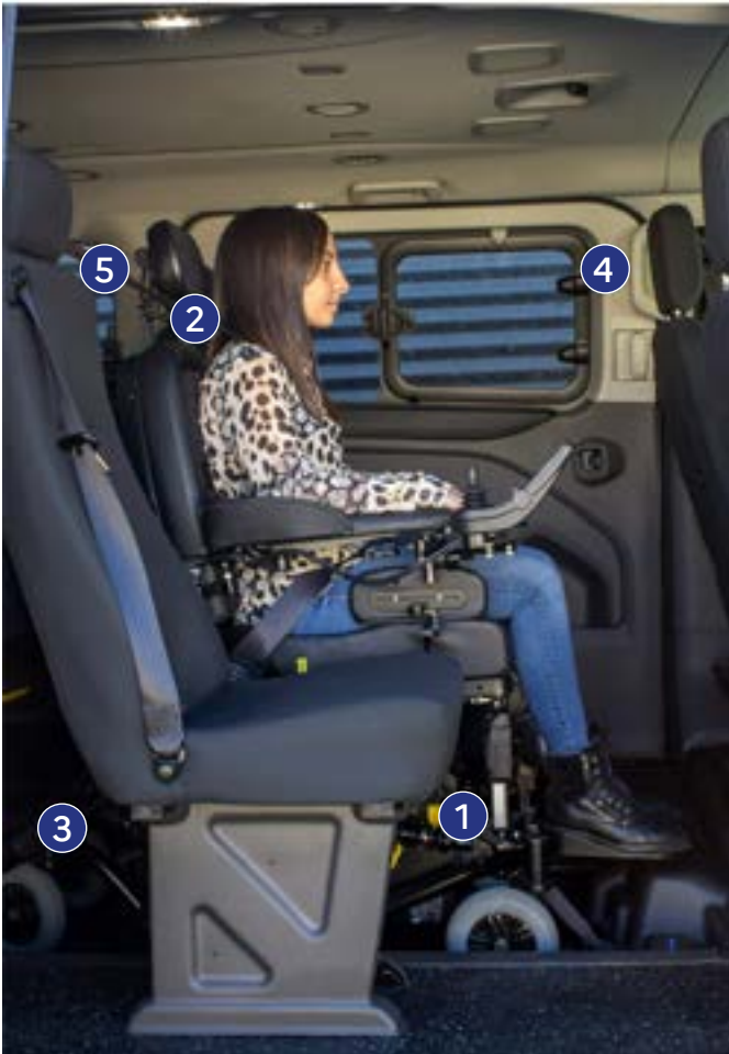
Figure 2 : installation passager (rang 2)